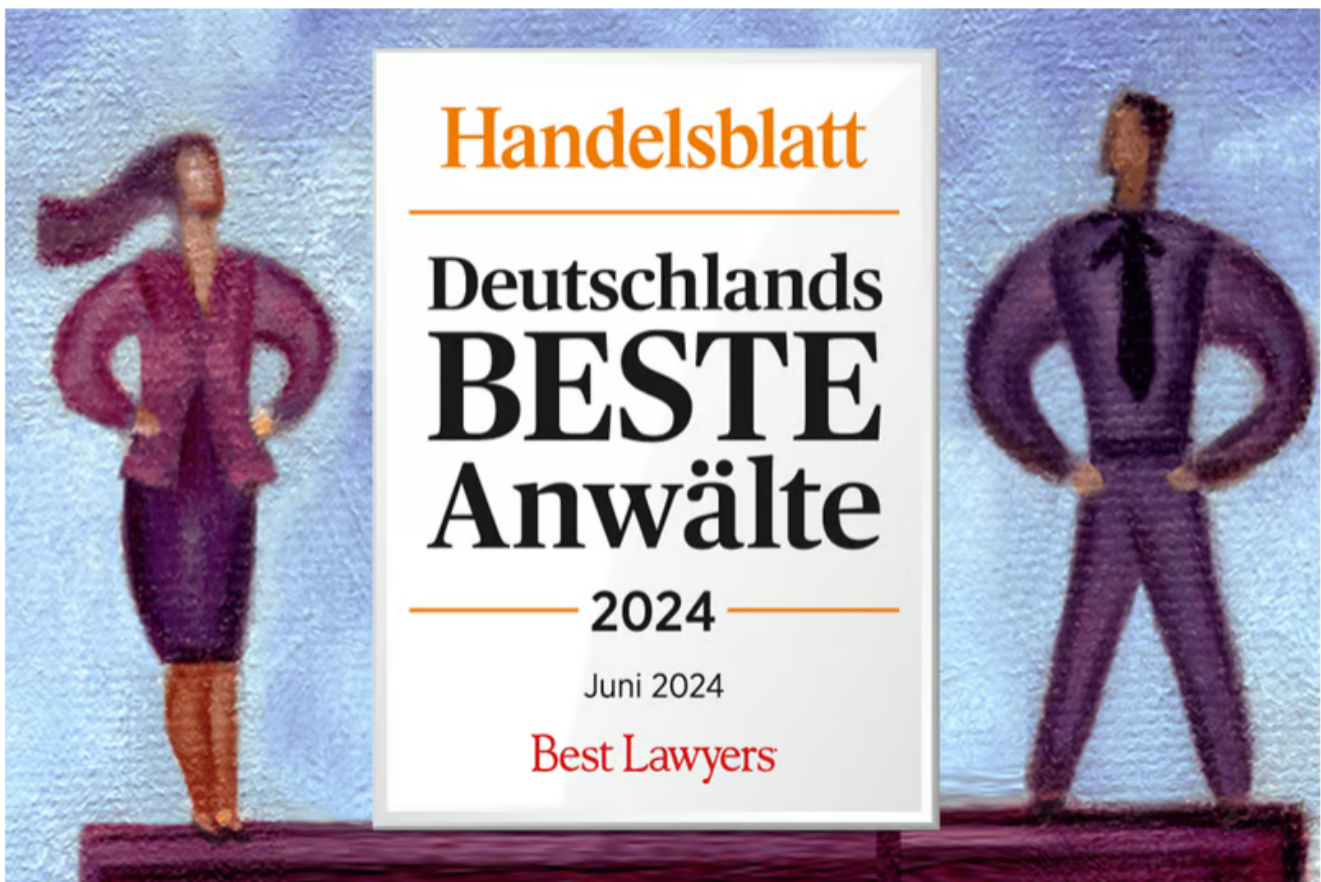
Der US-Verlag Best Lawyers hat für das Handelsblatt die besten Wirtschaftsanwälte Deutschlands ermittelt.